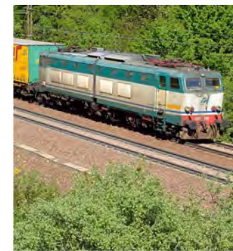
TAVOLA ROTONDA ULTRASPORTI Milano - 24 ottobre 2014

24 ottobre 2014, dalle ore 14 alle ore 18, presso l'Hotel Madison in Via Leopoldo Gasparotto 8 a 100 metri dalla Stazione Centrale.